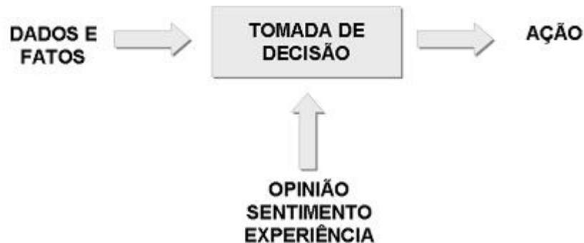
Figura 1 - tomada de decisão

Exemplo de aplicação dos 5 porquês: Monumento do Presidente Abraham Lincoln.