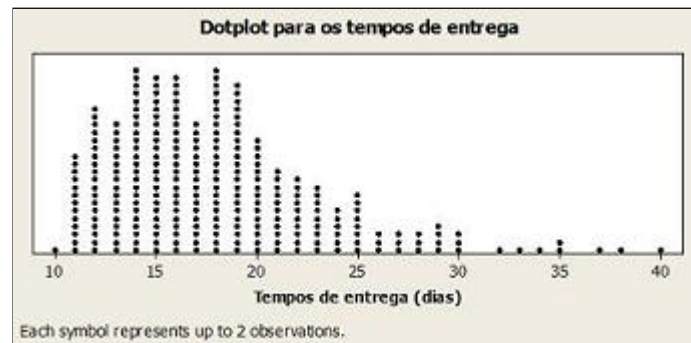
Figura 2 - exemplo de dados não-normalmente distribuídos

Quando estamos analisando um processo que não apresenta distribuição normal, existem diferentes formas de tratar os dados, dependendo do objetivo da análise: